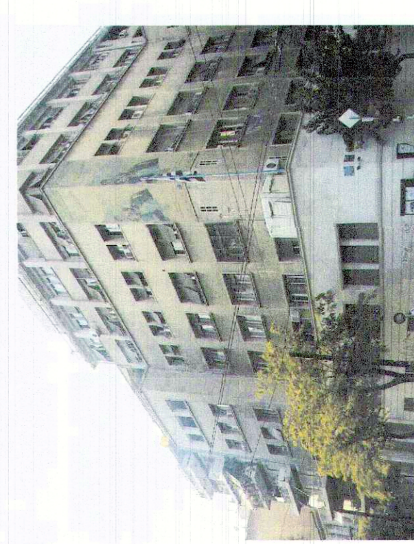
ΦΩΤΟΓΡΑΦΙΑ ΑΠΟ ΒΕΣΗ ΜΗΜΗΣ 3