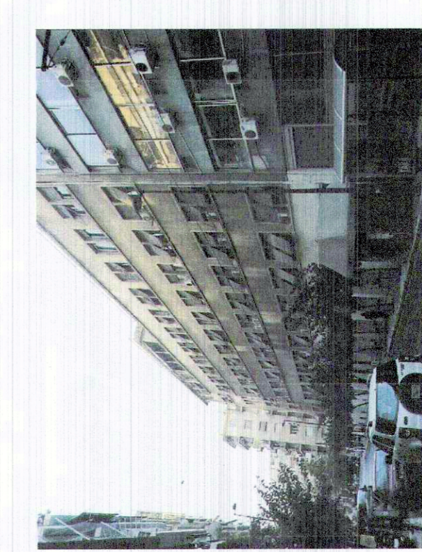
ΦΩΤΟΓΡΑΦΙΑ ΑΠΟ ΒΕΣΗ ΜΗΜΗΣ 2