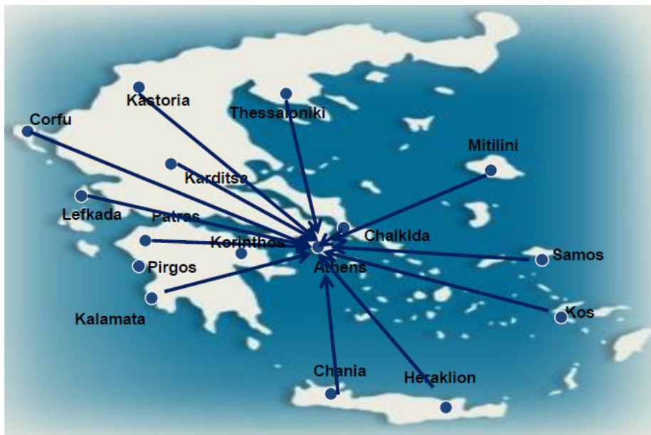
Εικόνα 2. Περιοχές από όπου προέρχονται οι δότες μητρικού γάλακτος

Η τράπεζα γάλακτος του Νοσοκομείου Ελενα Ε Βενιζέλου λειτουργεί από το 1947 και είναι από τις πρώτες τράπεζες μητρικού γάλακτος που λειτούργησαν στον κόσμο. Η τράπεζα γάλακτος του Μαιευτηρίου Ελενα Ε Βενιζέλου από την πρώτη μέρα της λειτουργίας της, παίζει τον ρόλο, τρόπον τινά, μιας εθνικής τράπεζας γάλακτος. Στην εικόνα 2, που ακολουθεί, φαίνονται οι περιοχές από όπου μητέρες, ανεξάρτητα χιλιομετρικής απόστασης, στέλνουν το γάλα τους για τις ανάγκες της τράπεζας μας. Η Τράπεζα Γάλακτος του Ελενα Ε Βενιζέλου εξυπηρετεί τις ανάγκες της Μονάδας Εντατικής Νοσηλείας Νεογνών του Νοσοκομείου αλλά και άλλων μαιευτηρίων, δημοσίων και ιδιωτικών, σύμφωνα πάντα με τη διαθεσιμότητα αποθεμάτων μητρικού γάλακτος. Τα έξοδα μεταφοράς του ανθρώπινου μητρικού γάλακτος από όλη την Ελλάδα αναλαμβάνει με ειδικά κριτήρια επιλογής το Μαιευτήριο Έλενα Ε Βενιζέλου.